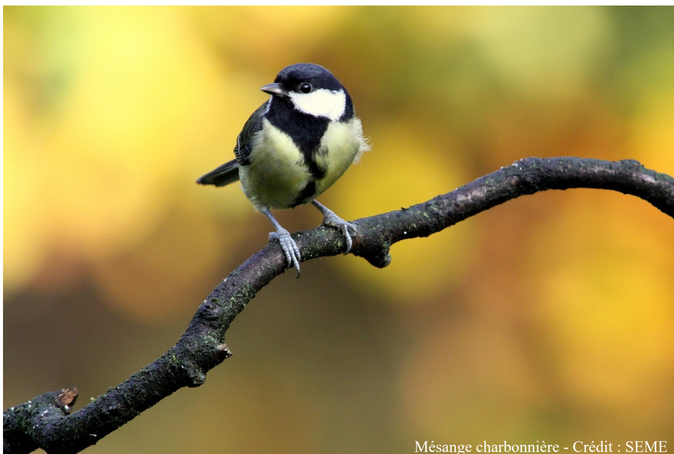
Mésange charbonnière